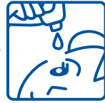
容器の先と目やまつ毛がふれることのないように